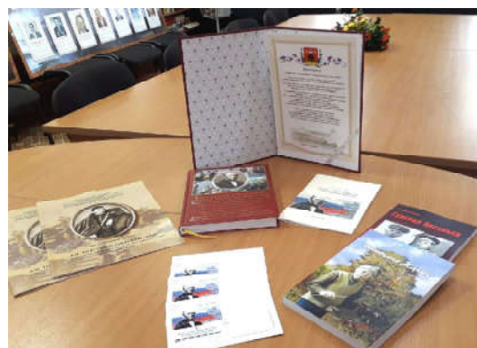
Подарочные издания для библиотеки