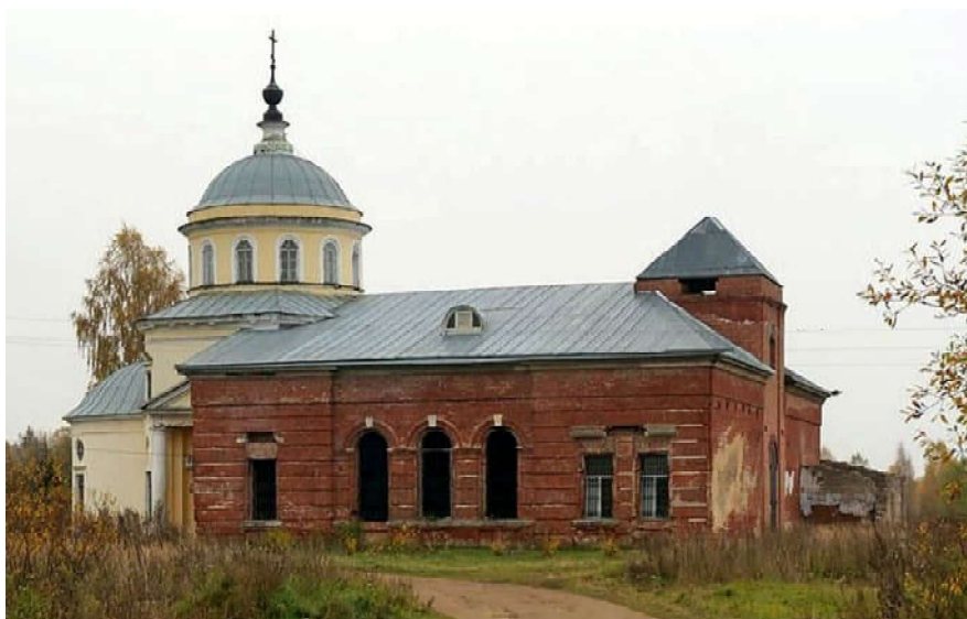
Храм Воскресения Словущего