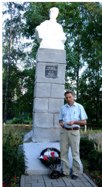
Цветы от земляков. Август 2018 года

шедевров которых является Воскресенский собор», – подчеркивают авторы законопроекта в сопроводительных материалах к документу. По их мнению, возвращение городу его исторического названия Романов-Борисоглебск будет способствовать «не только сохранению географического названия как составной части исторического и культурного наследия народов России, но и патриотическому воспитанию подрастающего поколения города в целях познания истории родной земли». Переименование города поддержала РПЦ: во всех храмах местной епархии прошли молебны за переименование Тутаева.