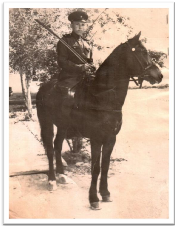
Во время службы в армии